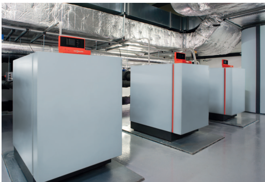
Pompa ciepła solanka/woda o mocy grzewczej od 21,2 do 42,8 kW (jednostopniowa), lub 42,4 do 85,6 kW (dwustopniowa) oraz maksymalnie 428 kW w układzie kaskadowym

Wyspecjalizowane źródło ciepła o zakresie mocy od 21,2 do 42,8 kW jako jednostopniowa pompa ciepła solanka/woda oraz od 28,1 do 58,9 kW jako pompa ciepła woda/woda.