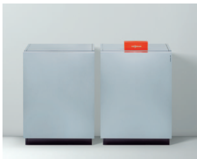
Dwustopniowa pompa ciepła Vitocal 300-G (master/slave)

Vitocal 300-G posiada certyfikat jakości Europejskiego Stowarzyszenia Pomp Ciepła (EHPA)