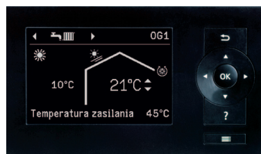
Wyświetlacz regulatora Vitotronic 200

Regulator Vitotronic 200 przystosowany jest do współpracy z modułem komunikacyjnym Vitocom 300, dzięki czemu możliwe jest zdalne sterowanie poprzez Internet także za pomocą urządzeń mobilnych odpowiednią aplikacją firmy Viessmann.